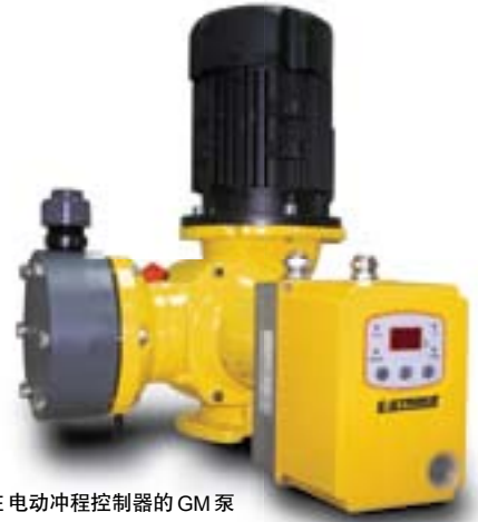
带 E-STROKE 电动冲程控制器的 GM 泵